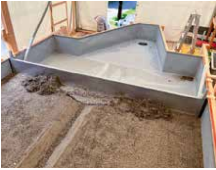
Eingebauter Biberdamm und Auslauf im physikalischen Modellversuch